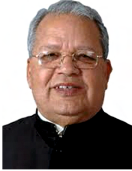
श्री कलराज मिश्र महामहिम राज्यपाल एवं कुलाधिपति

Tel. 0294-2470166, 2470707, Fax : 0294-2471150 E-mail : registrar@mlsu.ac.in Website : www.mlsu.ac.in